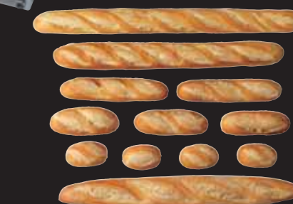
PRODUCCIÓN DE TIPOS DE PAN