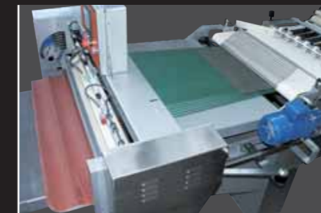
Detalle del acoplamiento de la Maxi "Mixta"