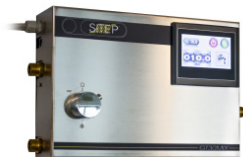
GT 30 MIX C