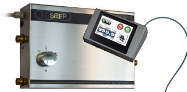
GT 30 MIX C - REM