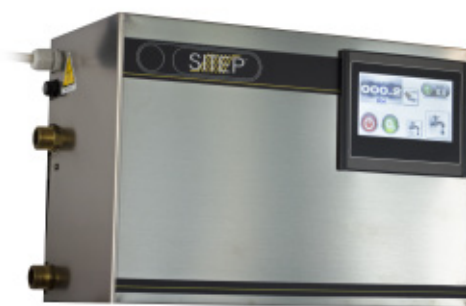
GT 30 MATIC