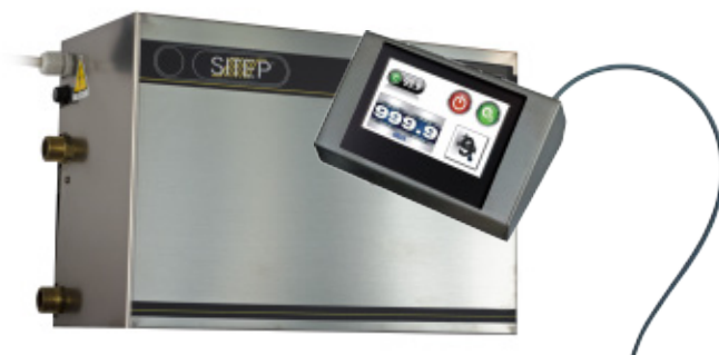
GT 30 - REM