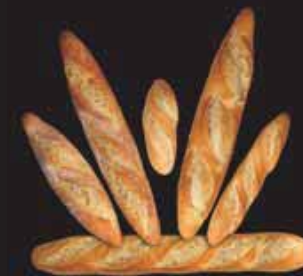
PRODUCCIÓN DE TIPOS DE PAN